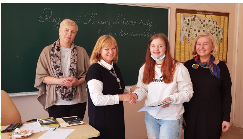
„Dvylikos laiptelių“ redakcija