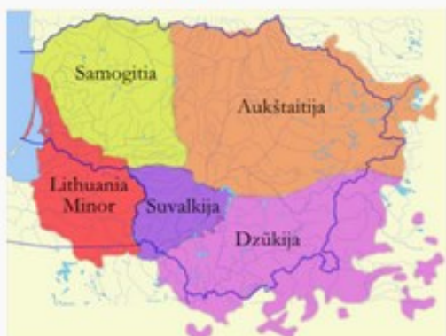
Žemėlapyje pažymėta šviesiai žalia spalva

Žemaičių virtuvėje patiekalus populiariau gardinti kmynais. Prie daugelio patiekalų patiekiamos bulvės su lupenomis, o riebus padažas gaminami ir kaip priedas, ir kaip patiekalo užpilas. Kaip patys žemaičiai pasakytų, bulvių kugelis (plokštainis) yra pirštų laižymo vertas skanumėlis. O kad jis būtų toks skanus, į plokštainį pilama rauginto pieno, dedama grietinės arba grybų. Žemaičių mėgiama taip vadinama cibulynė yra šaltsriubė (vanduo, silkė, svogūnas, prieskoniai, viskas valgoma su bulvėmis, virtomis su lupenomis). Vietiniai pasakoja, kad silkę pirmiausia reikia įvynioti į šlapią popierių ir pakepinti ant žarijų. Tai patiekalui suteikia savitą skonį. Kitas žemaičių virtuvės skanėstas – kastinys. Tai valgis iš grietinės bei sviesto su prieskoniais. Kastinys dažniausiai valgomas su karštomis bulvėmis, išvirtomis su lupenomis, tačiau jį galima ragauti ir su kiaušiniai, duona ar košėmis.